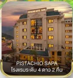
PISTACHIO SAPA โรงแรมระดับ 4 ดาว 2 คืน