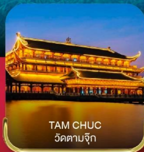
TAM CHUC วัดตามจุก