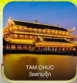
TAM CHUC วัดตามจุก