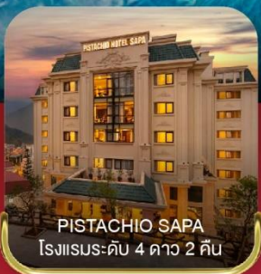
PISTACHIO SAPA โรงแรมระดับ 4 ดาว 2 คืน